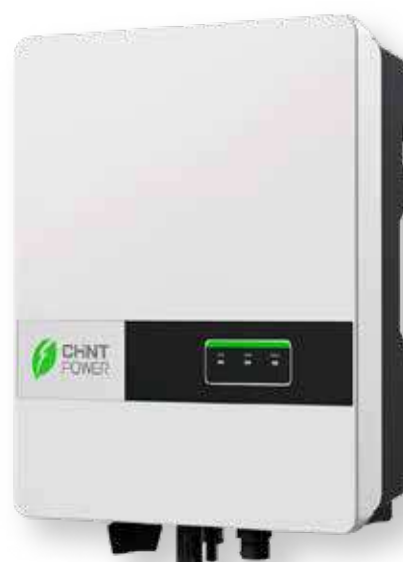
Inversor 5 - 6 kW