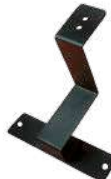
Accesorio Teja de Barro