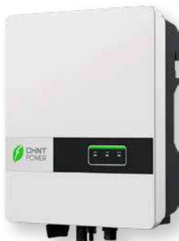
Inversor 3,6 kW